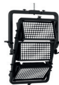
ML800MB3VH Lyre modulaire