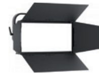
ML800BD2 Volets 4 faces