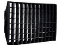
ML800G40SB SnapGrid 40 ° pour SnapBag